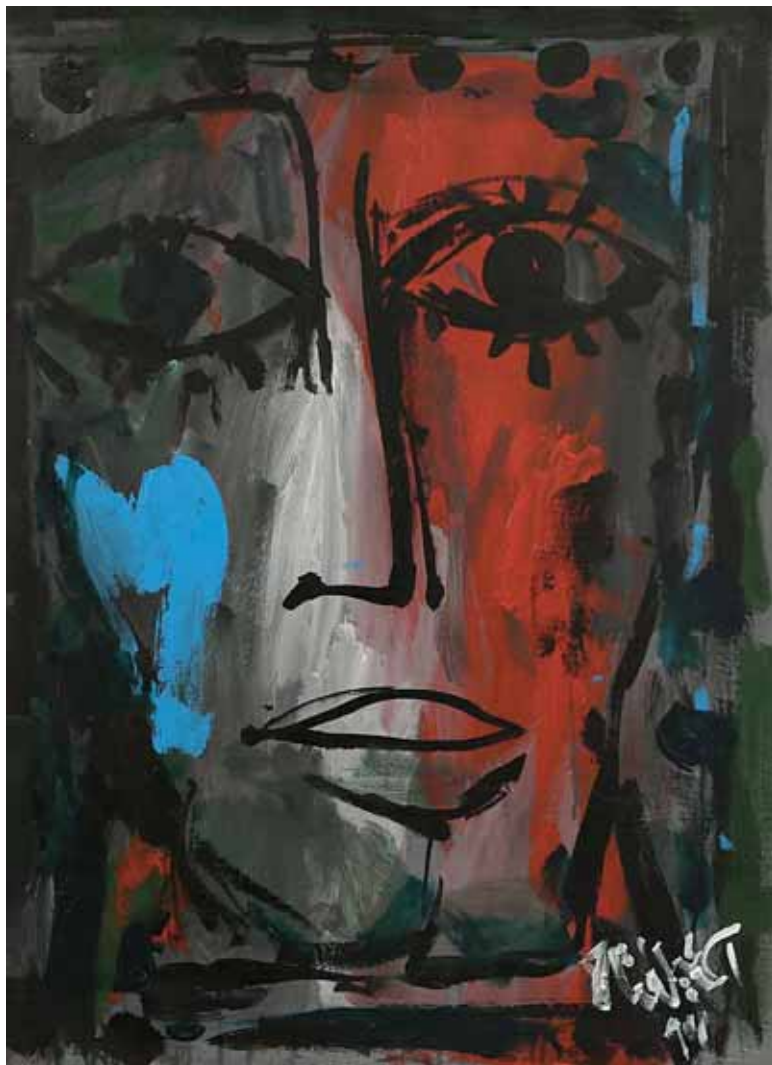
acrylique sur bois, 1994 – 70x50cm