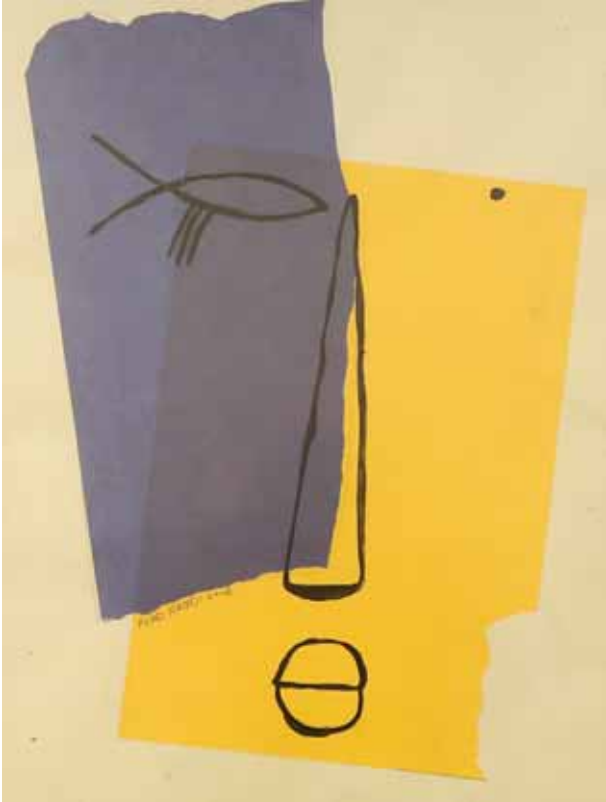
collage, 2008, 60x44cm