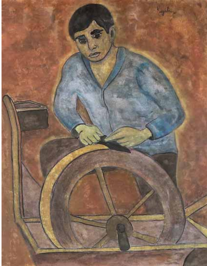
huile sur carton, 58x45cm