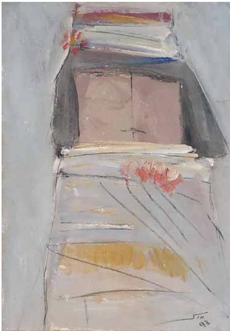
acrylique sur carton, 1993 - 50x35cm