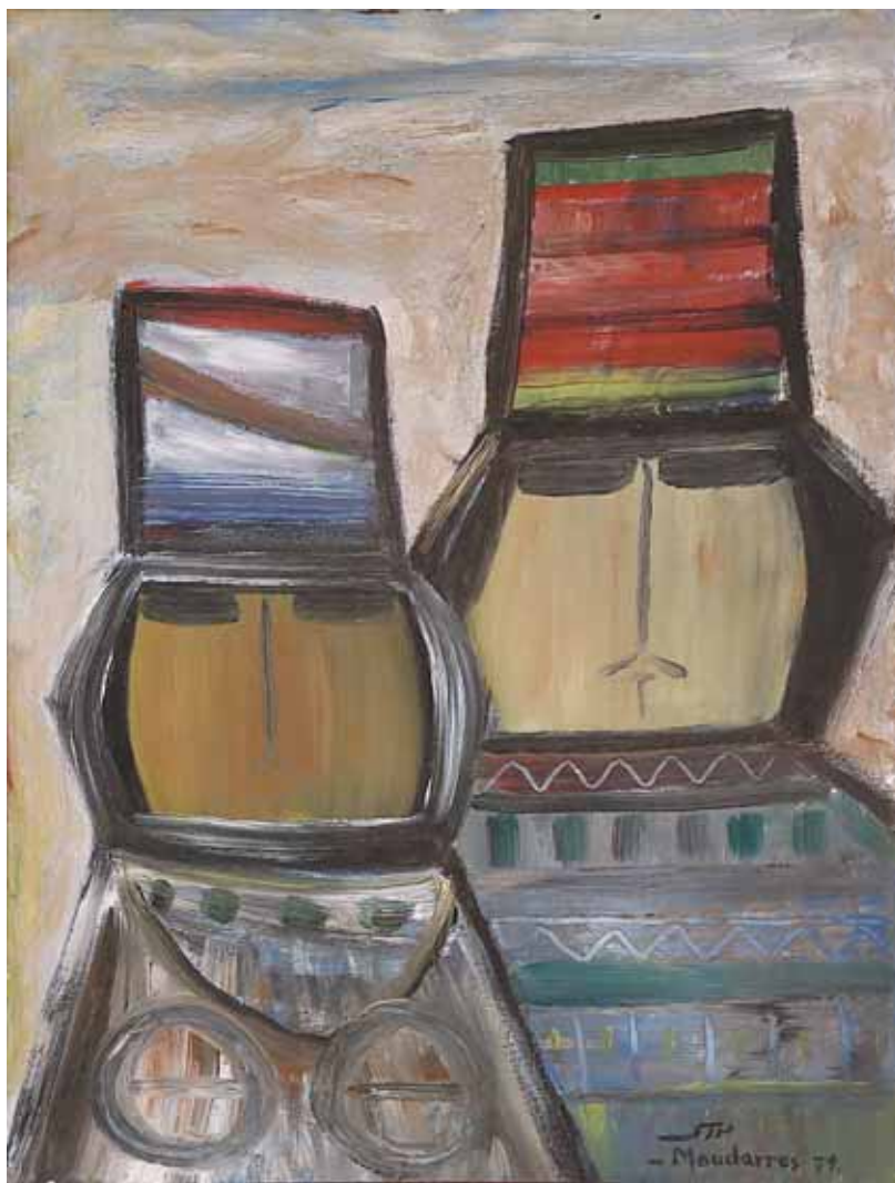
Huile sur toile, 1979 - 60x45cm