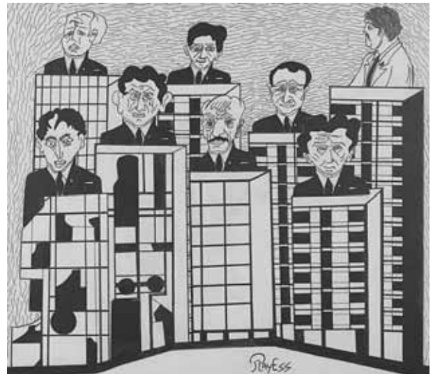
Encre sur papier, 35x40cm