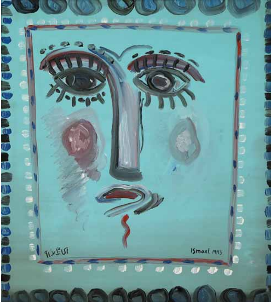
acrylique sur bois, 1993 – 89x80cm