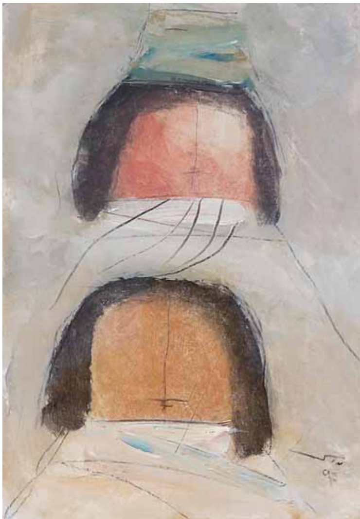
acrylique sur carton, 1992 - 50x35cm