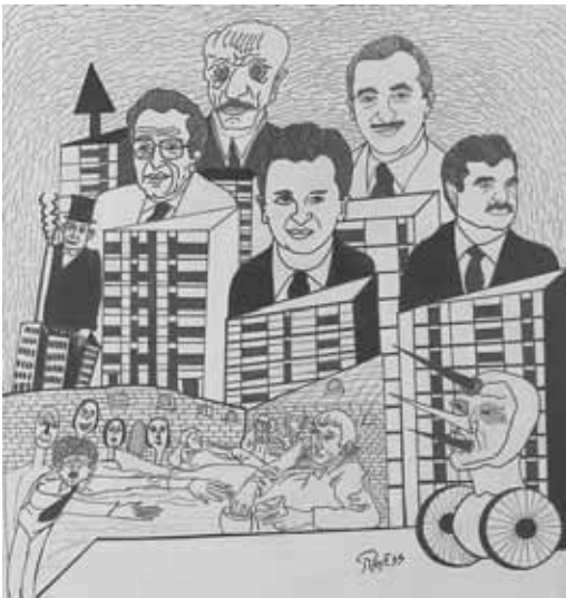
Encre sur papier, 48x45cm