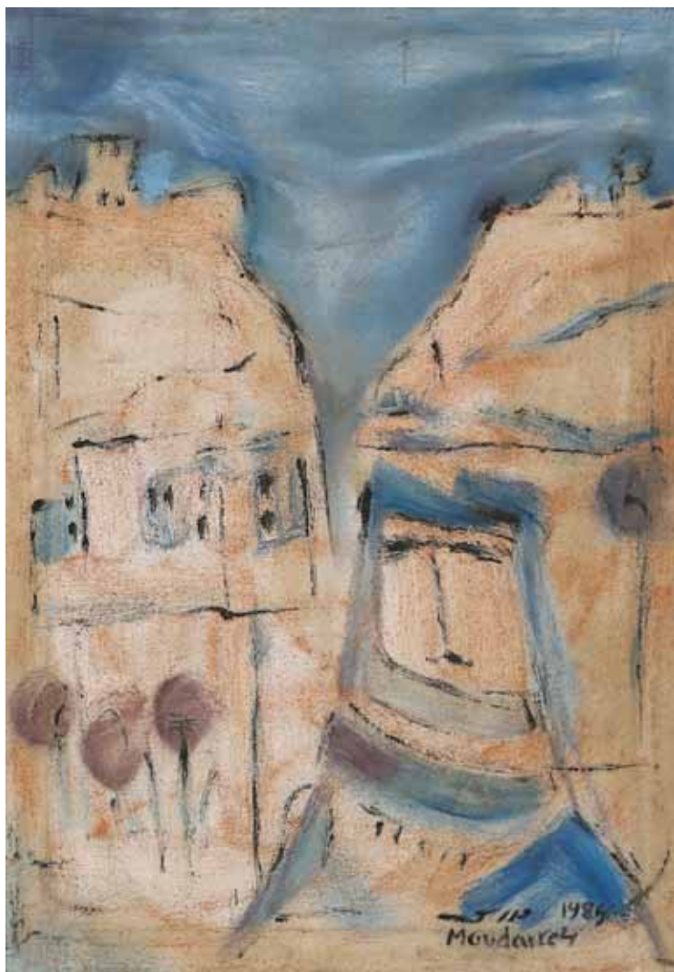
huile sur toile, 1985, 71x50cm