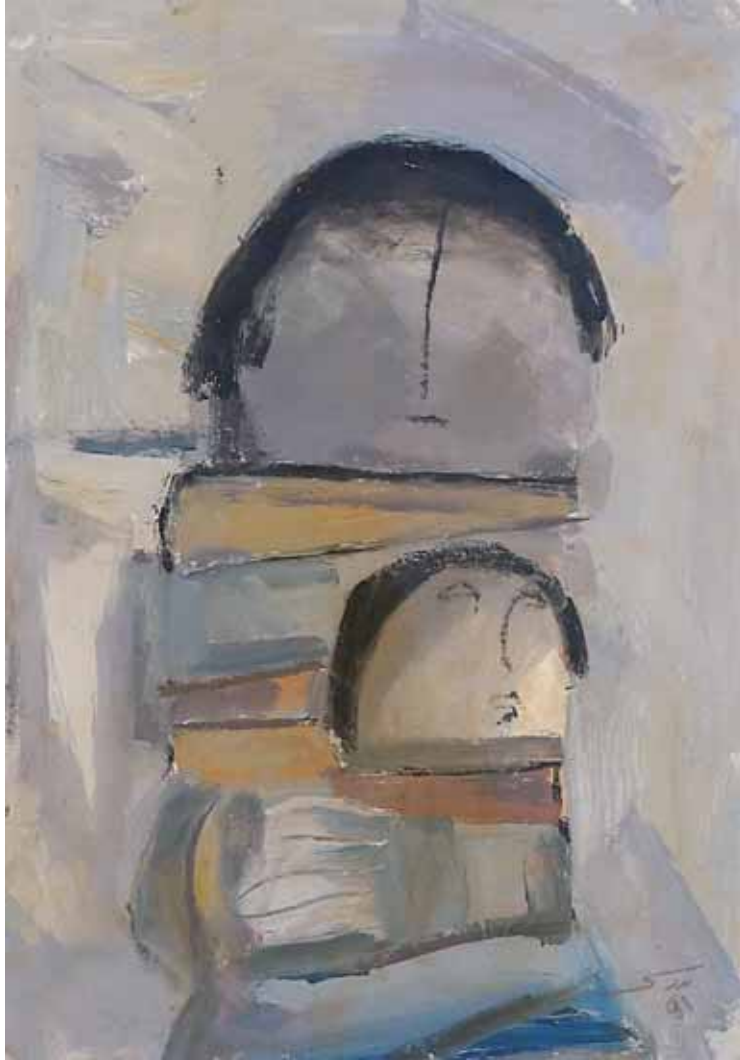
acrylique sur carton, 1991 - 50x35cm