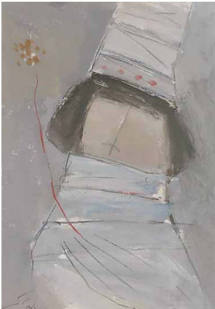
acrylique sur carton, 1992 - 50x35cm