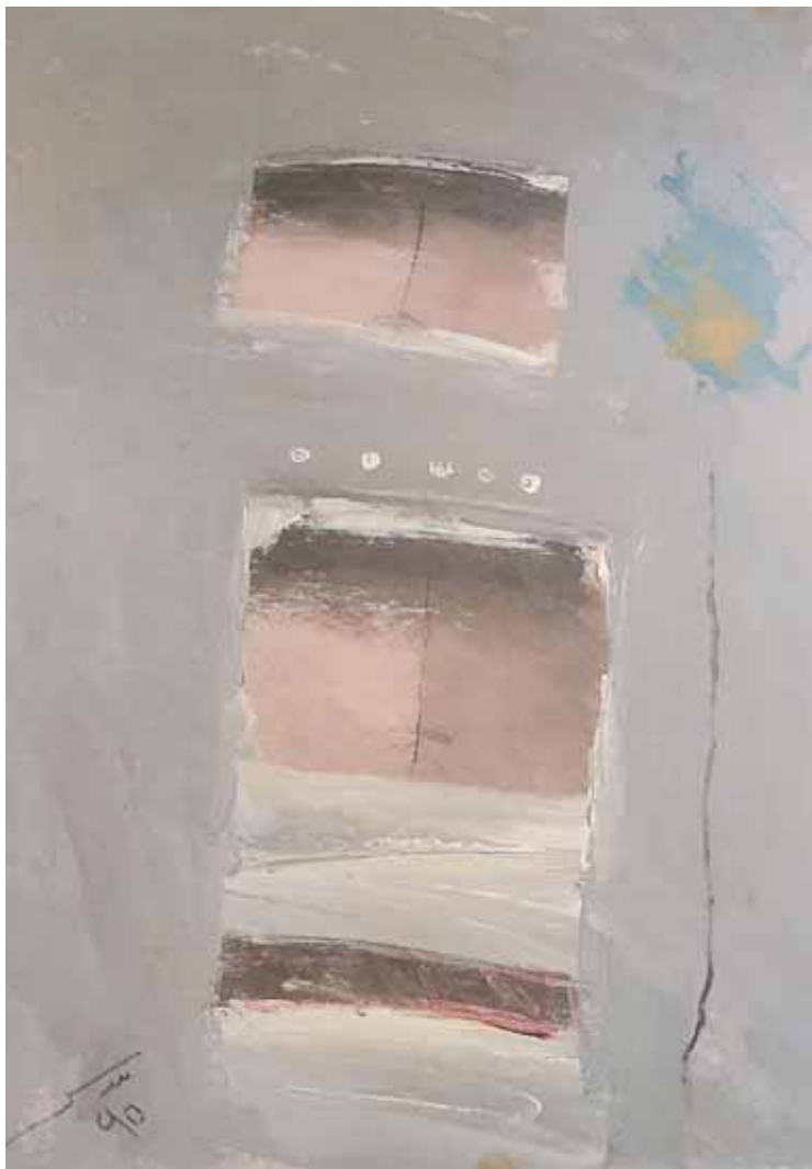
acrylique sur carton, 1995 - 50x35cm