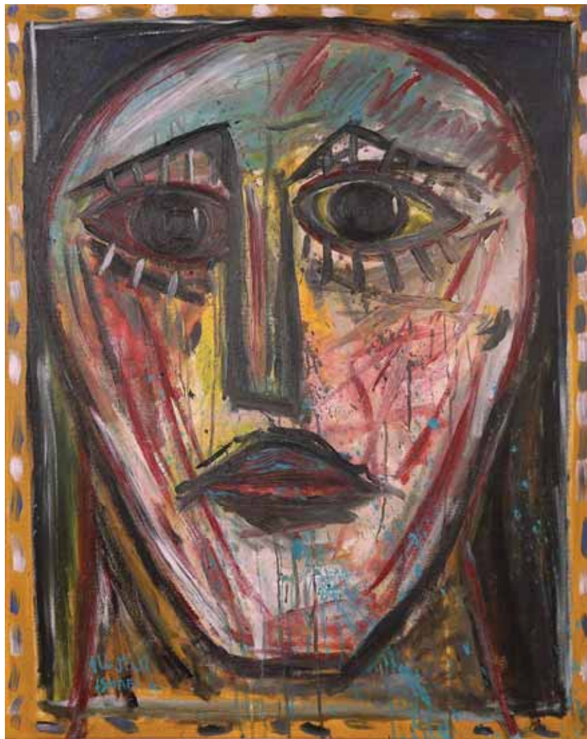
acrylique sur toile, 1982 - 100x80cm