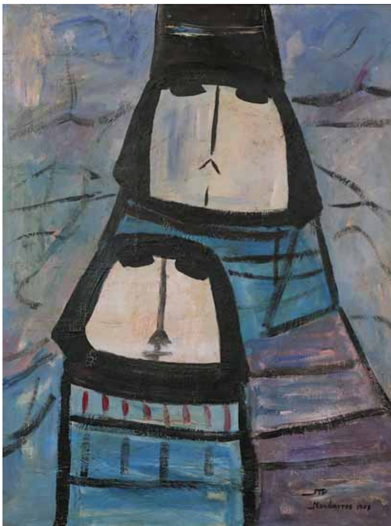
huile sur toile, 1978 - 80x60cm