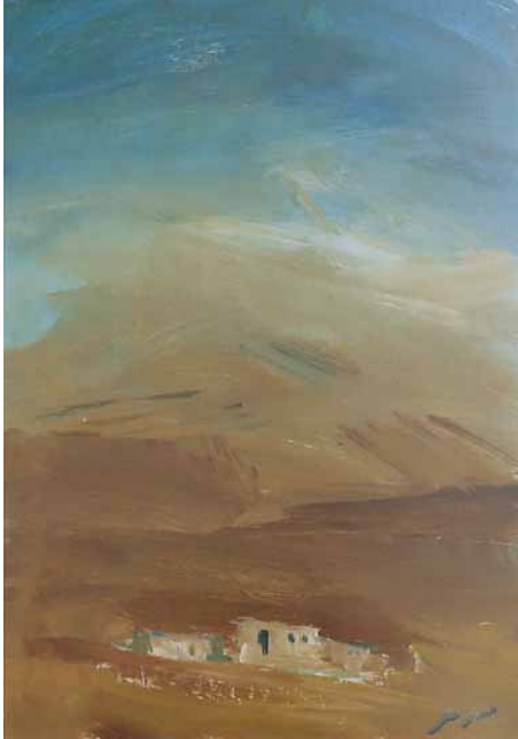
acrylique sur carton, 50x35cm