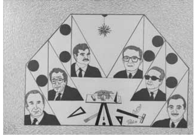
Encre sur papier, 50x70cm