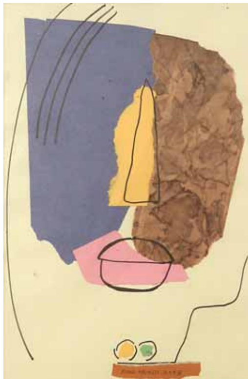
collage, 2008, 45 x30cm

Expositions personnelles et collectives en Irak, en Syrie, en Italie et au Canada. Vit et travaille au Canada.