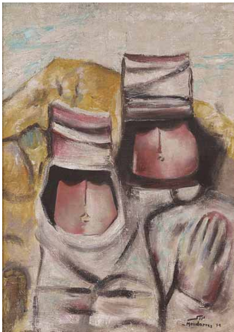
huile sur toile, 1979 - 70x50cm