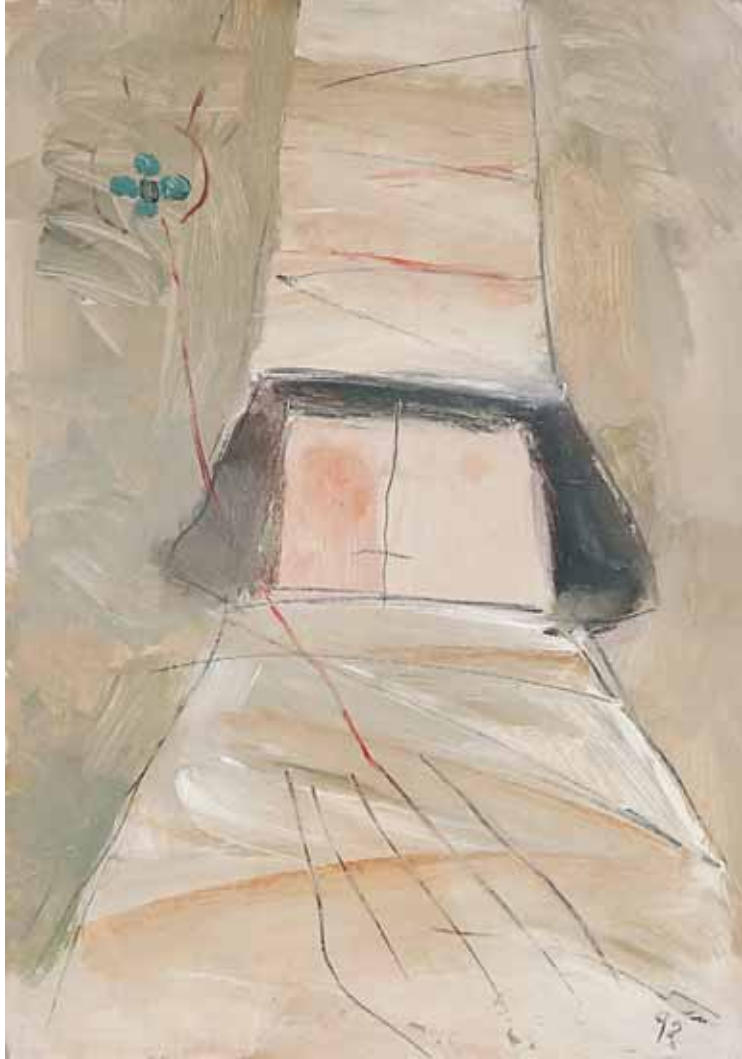
acrylique sur carton, 1992 - 50x35cm