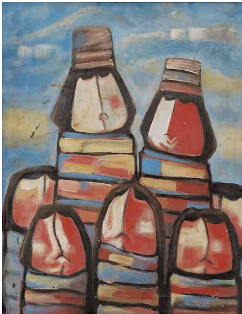
huile sur toile - 59x46cm