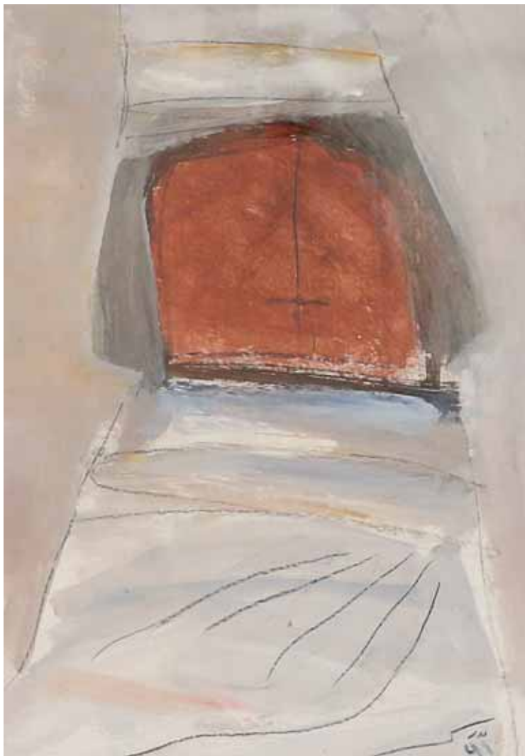
acrylique sur carton, 1991 - 50x35cm