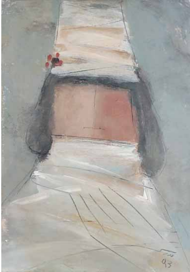
acrylique sur carton, 1993 - 50x35cm