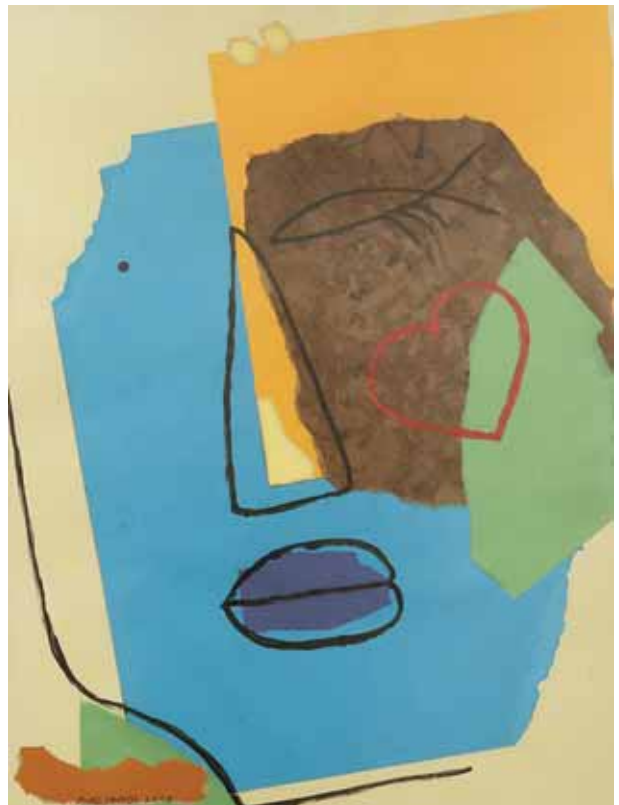
collage, 2008, 60x45cm