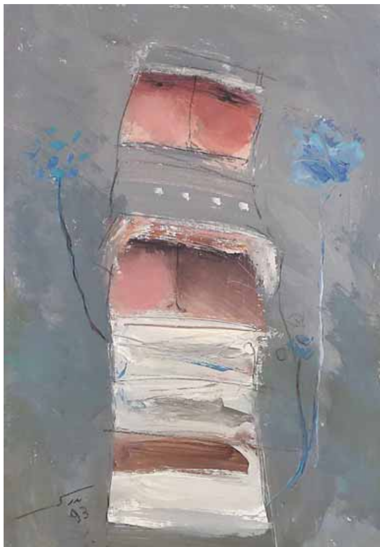
acrylique sur carton, 1993 - 50x35cm